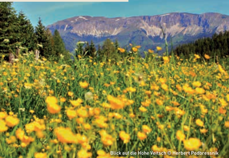
Blick auf die Hohe Veitsch